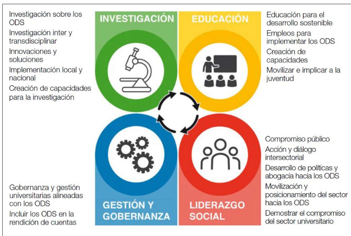
Figura 1. Una visión general de la contribución de las universidades a los ODS.